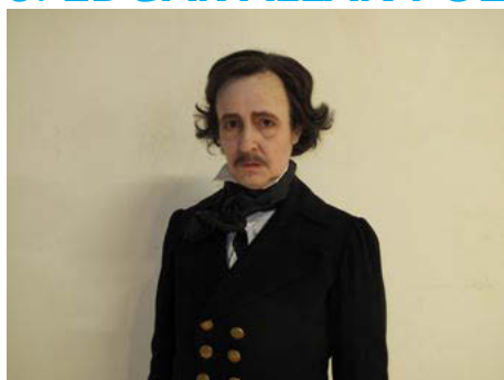
M.2062 (Edgar Allan Poe) at Palais de Tokyo (Paris), December 4, 2013. Presented as part of Gonzalez-Foerster's contribution to Philippe Parreno's solo exhibition, Anywhere, Anywhere Out of the World .