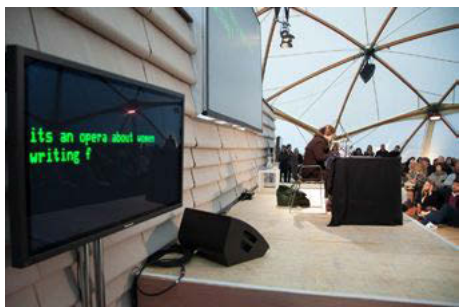
M.2062 (DGF) at Serpentine Gallery (London), October 13, 2012. Presented as part of "Memory Marathon."