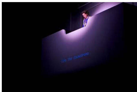
M.2062 (Ludwig) at Stedelijk Museum Amsterdam, January 17, 2013. Presented as part of "Stage It! (Part 2)."