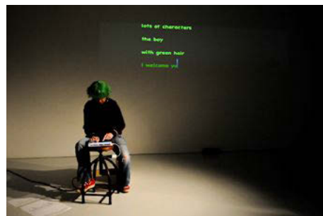
M.2062 (The Boy with Green Hair) at the Irish Museum of Modern Art (Dublin), June 21, 2013. Presented at the opening of Cloud Illusions I Recall , an exhibition curated by Cerith Wyn Evans and Gonzalez-Foerster.