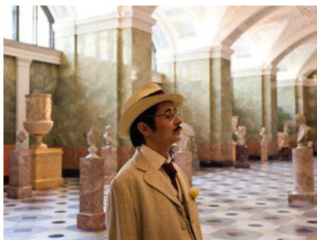
M.2062 (Promenade with Aschenbach) at the General Staff Building and Winter Palace (Saint Petersburg), June 14, 2014. Presented at Manifesta 10 .